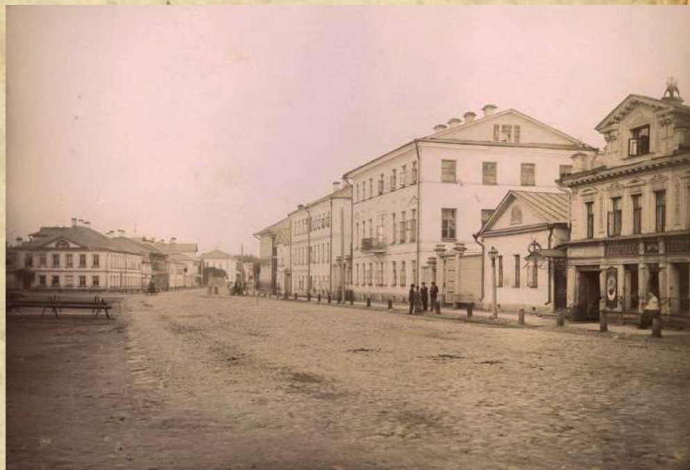
Вид 19 века