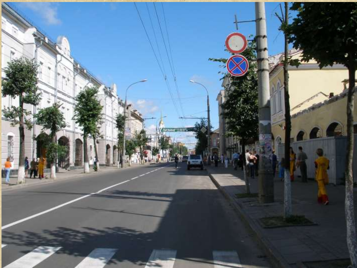
Современный вид улицы Крестовой