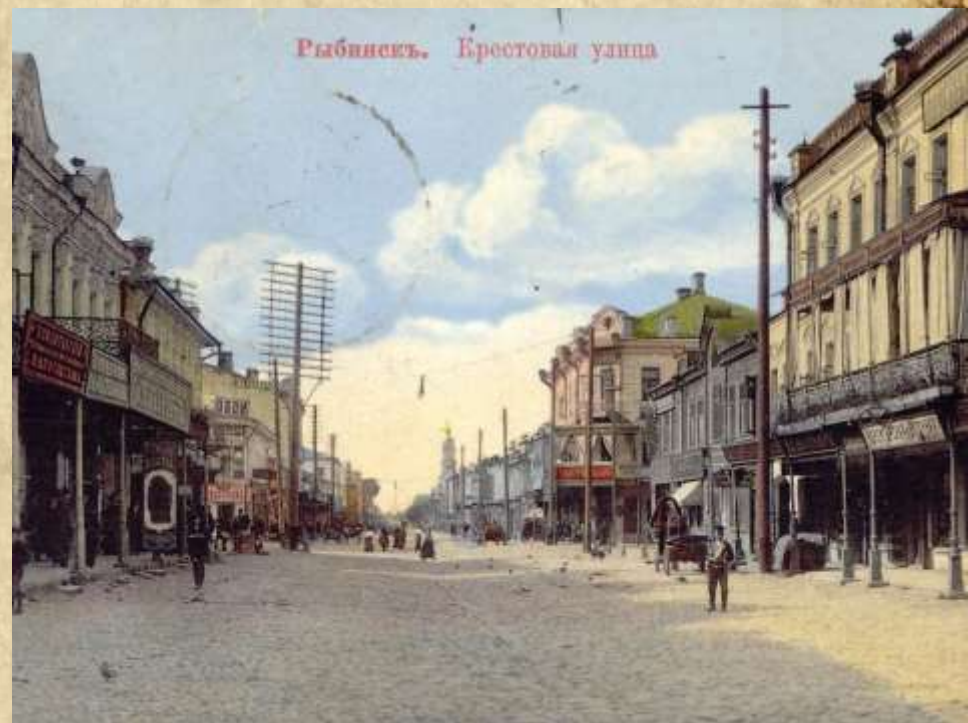
Вид 19 века