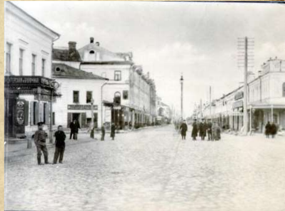
Вид 19 века