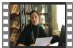
№1_адаптация в 1 классах