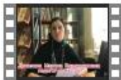
№2_адаптация в 5 классах